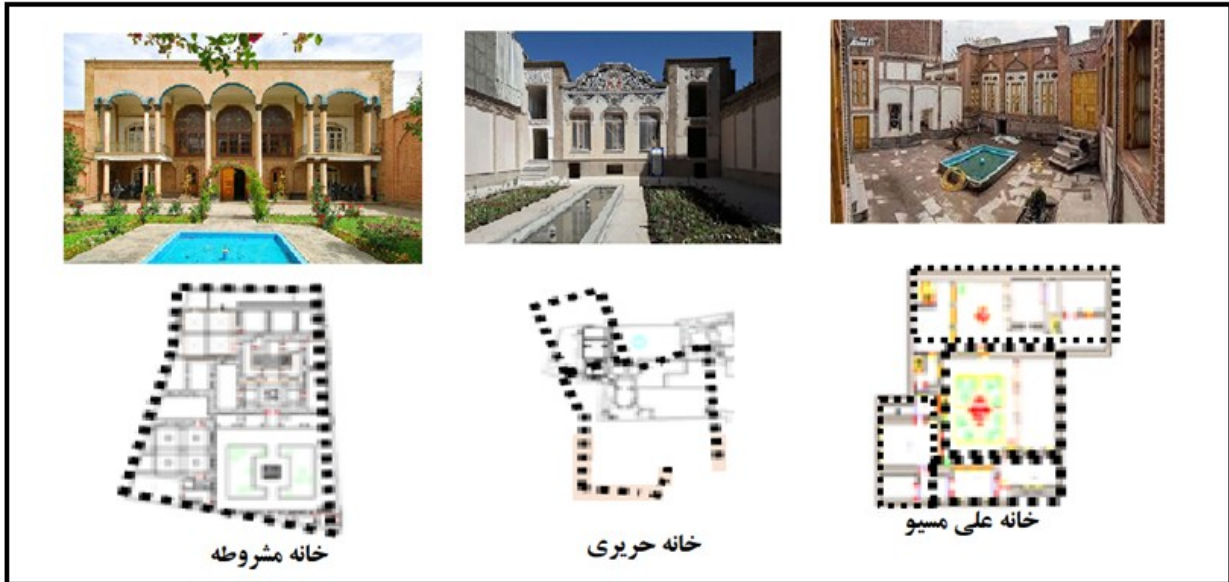
شکل ۱. شناسایی خانه های مورد مطالعه منبع: یافته های تحقیق ۱۴۰۴