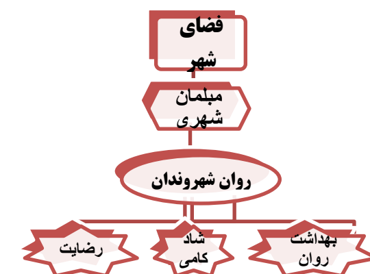
شکل ۲. مدل مفهومی: چهارچوب نظری پژوهش