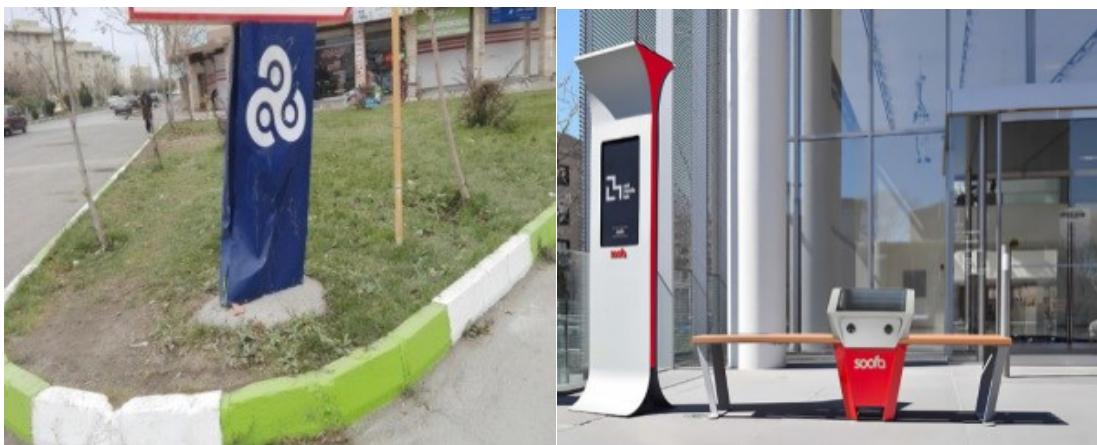
شکل ۱. دو نمونه کیوسک و تأثیر بصری این دو مبلمان شهری

در زندگی شهری امروز، به ندرت می توان کسی را یافت که به طریقی با مبلمان شهری سرو کار نداشته باشد؛ سرپناه ایستگاه اتوبوس، باجه بلیت فروش، نیمکت پارک یا تابلوی راهنمایی و رانندگی فرقی نمی کند در هر حال با یک یا چند گروه از آنها ارتباط داریم. مبلمان شهری بخش زیادی از فعالیت در شهر را سامان می دهد و باعث بالا رفتن کیفیت استفاده شهروندان از خیابان، میدان، پارک و عرصه های دیگر شهری می شود. (مرتضایی، ۱۳۸۱) با توجه به اینکه هدف اصلی برنامه ریزی شهری تأمین سلامت، آسایش و رفاه در شهر می باشد توجه به مبلمان شهری در مکان یابی صحیح آنها، انتخاب مواد مناسب، نصب و طراحی صحیح فضاهای شهری راه رسیدن به این اهداف را در حیطه مربوطه خود هموار می سازد. مبلمان شهری سهم مهمی در به وجود آوردن آرامش و سلامت روحی و ذهنی افراد داشته باشد. گاهی شلوغی و اغتشاش عناصر چنان است که نه تنها آرامشی را به دنبال ندارد، بلکه باعث سردرگمی و آشفتگی شهروندان نیز می شود، به گونه ای که انسان خسته از کار روزانه هیچ رغبتی برای نشستن و استفاده کردن از فضای شهری و مبلمان آن ندارد (Wood, L, et.a, 2017). با گذشت هر چه بیشتر زمان، میل و رغبت روزافزون انسانها به زندگی شهری و رقابت چشم گیر آنها در تصاحب موقعیت های شغلی، تجاری، ... زندگی شهری، باعث شده که تقریباً تمام تلاش انسانها در زندگی روزمره تک بعدی شده و کمتر کسی اهمیتی به محیط پیرامون و محل زندگی خود دهد و همین امر به مرور باعث ایجاد ناهماهنگی ها و نازیبایی های محل زندگی گردیده و آثار مخرب روحی و روانی آن متوجه خود انسان می گردد (Holttum, S. 2013).