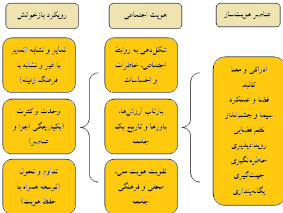
شکل ۳. مؤلفه‌های تأثیرگذار بر هویت اجتماعی معماری و بازخوانش آن

در نهایت می‌توان عنوان کرد که عناصر هویت‌ساز مختلف معماری همچون ادراکی و معنا، کالبد، فضا و عملکرد، سیما و چشم‌انداز، نظم فضایی، رویدادپذیری، خاطره‌انگیزی، جهت‌گیری و یگانه‌پنداری موجب شکل‌گیری هویت اجتماعی در معماری در ابعاد مختلف شکل‌دهی به روابط اجتماعی، خاطرات و احساسات، بازتاب ارزش‌ها، باورها و تاریخ یک جامعه و تقویت هویت ملی، محلی و فرهنگی جامعه می‌گردد. همچنین بازخوانش این مؤلفه‌ها بایستی بر مبنای رویکرد زمینه‌گرایی و منطقه‌گرایی باشد. به عبارتی تداوم ارزش‌های کالبدی و غیرکالبدی مکان با زمینه‌ی موجود و نوآوری در آن (تداوم/تحول)، ارتباط مناسب میان شکل-زمینه یا توده-فضا (وحدت/کثرت) و حفظ ویژگی‌ها و خصوصیات خاص مکان در مقایسه با سبک‌ها و الگوهای خارجی (تمایز/تشابه) بایستی مدنظر قرار گیرد. در این راستا تداوم/تحول و وحدت/کثرت ویژگی‌های زمینه‌گرایی و تمایز/تشابه ویژگی‌های منطقه‌گرایی محسوب می‌شوند (Frampton, 2000; Tzonis, 2003).